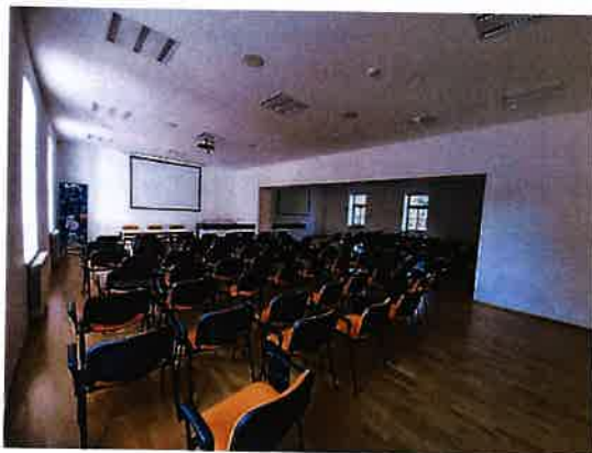
Slika 2.2. Multimedijalna dvorana, TICM1