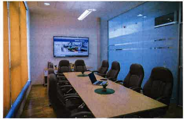
Slika 2.5. Soba za sastanke, TICM3