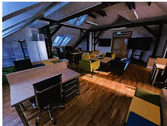
Slika 2.8. Coworking u potkrovlju TICM1 zgrade

U potkrovlju zgrade TICM1 dostupan je i prostor coworkinga / predinkubacije . Coworking je zajednički ured podijeljen u 10 radnih jedinica od kojih je svaka opremljena radnim stolom, stolicom te po potrebi drugim namještajem. Prostor je namijenjen nezavisnim profesionalcima ( freelancerima ), pojedincima i timovima koji rade na razvoju proizvoda, usluge ili projekta te drugim osobama koje imaju povremenu ili privremenu potrebu korištenja uredskog prostora.