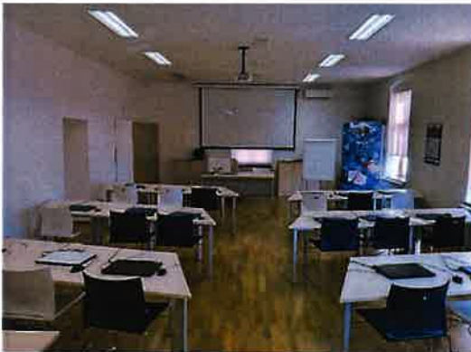
Slika 2.6. informatička učionica, TICM1