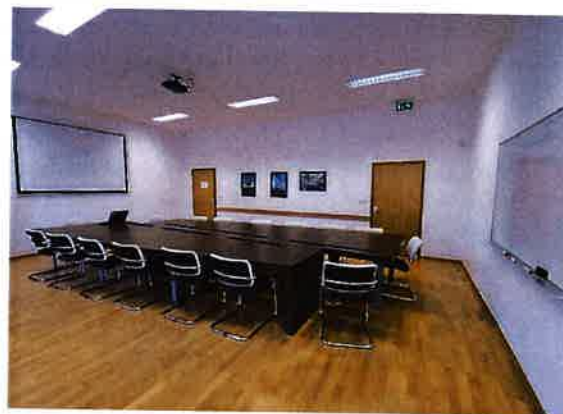
Slika 2.3. Soba za sastanke, TICM1