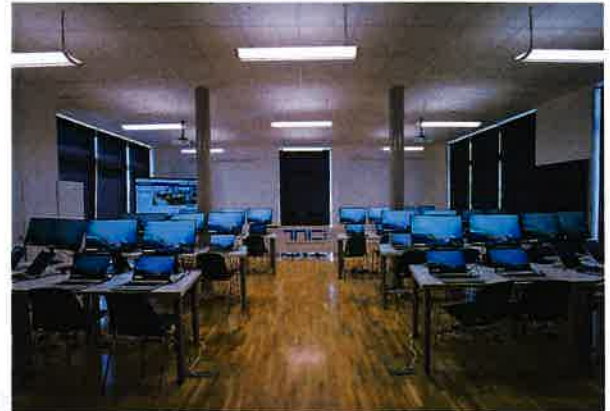
Slika 2.7. informatička učionica, TICM3

U potkrovlju zgrade TICM1 dostupan je i prostor coworkinga / predinkubacije . Coworking je zajednički ured podijeljen u 10 radnih jedinica od kojih je svaka opremljena radnim stolom, stolicom te po potrebi drugim namještajem. Prostor je namijenjen nezavisnim profesionalcima ( freelancerima ), pojedincima i timovima koji rade na razvoju proizvoda, usluge ili projekta te drugim osobama koje imaju povremenu ili privremenu potrebu korištenja uredskog prostora.