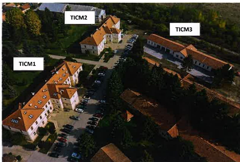
Slika 2.1. Zgrade TICM-a iz zraka