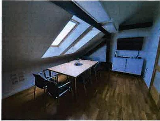
Slika 2.4. Soba za sastanke, potkrovlje TICM1 zgrade