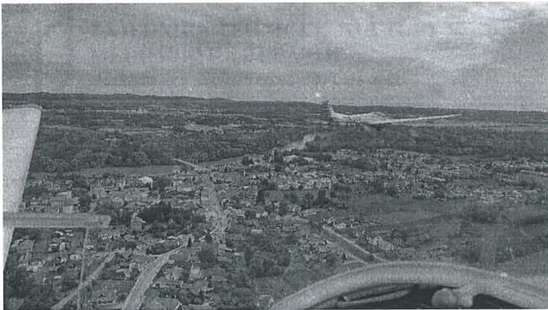
Mursko Središće, 2.7. 2022. Dan tehničke kulture Međimurske županije