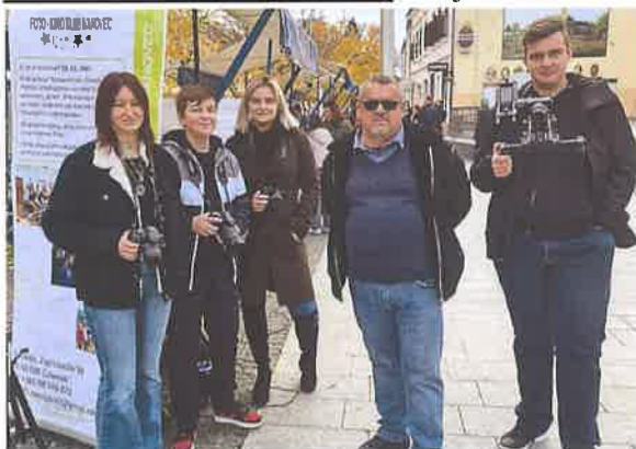
Foto-kino klub Ivanovec, broji 18 aktivnih članova. Bavimo se izradom dokumentarnih,

igranih i animiranih filmova te fotografijom. Klub je osnovan da okuplja mještane koji filmom i fotografijom bilježe aktivnosti svojih udruga. Klub je svoju prepoznatljivost gradio i izgradio zahvaljujući brojnim nagrađenim filmovima. Članovi kluba su učenici OŠ Ivanovec koji svoj rad nastavljaju u radu kluba i tijekom srednjoškolskog obrazovanja i fakulteta te učenici iz ostalih škola na području Grada Čakovca.