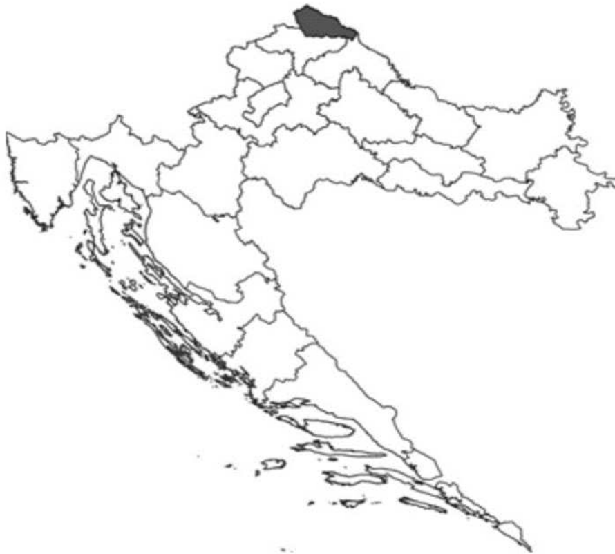
Slika 1. Položaj Međimurske županije u odnosu na prostor RH

Međimurska je županija najsjevernija županija Republike Hrvatske, smještena u njenom sjeverozapadnom dijelu na tromeđi Slovenije, Mađarske i Hrvatske. Sa sjeverne i zapadne strane, graniči s Republikom Slovenijom, na istoku s Republikom Mađarskom, dok se na jugu i jugozapadu nalazi granica s Varaždinskom, a na jugoistoku je granica s Koprivničko-križevačkom županijom. Međimurska županija prostire se na 730,0 km 2 i najmanja je županija Republike Hrvatske po površini s udjelom u teritoriju od 1,29%.