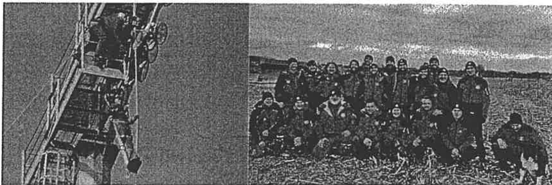
ČLANOVI HGSS STANICE ČAKOVEC 2019

Nitko od članova Stanice nije primio nikakve naknade niti dnevnice tijekom cijele 2019. godine za svoj rad i aktivnosti kroz rad u HGSS.