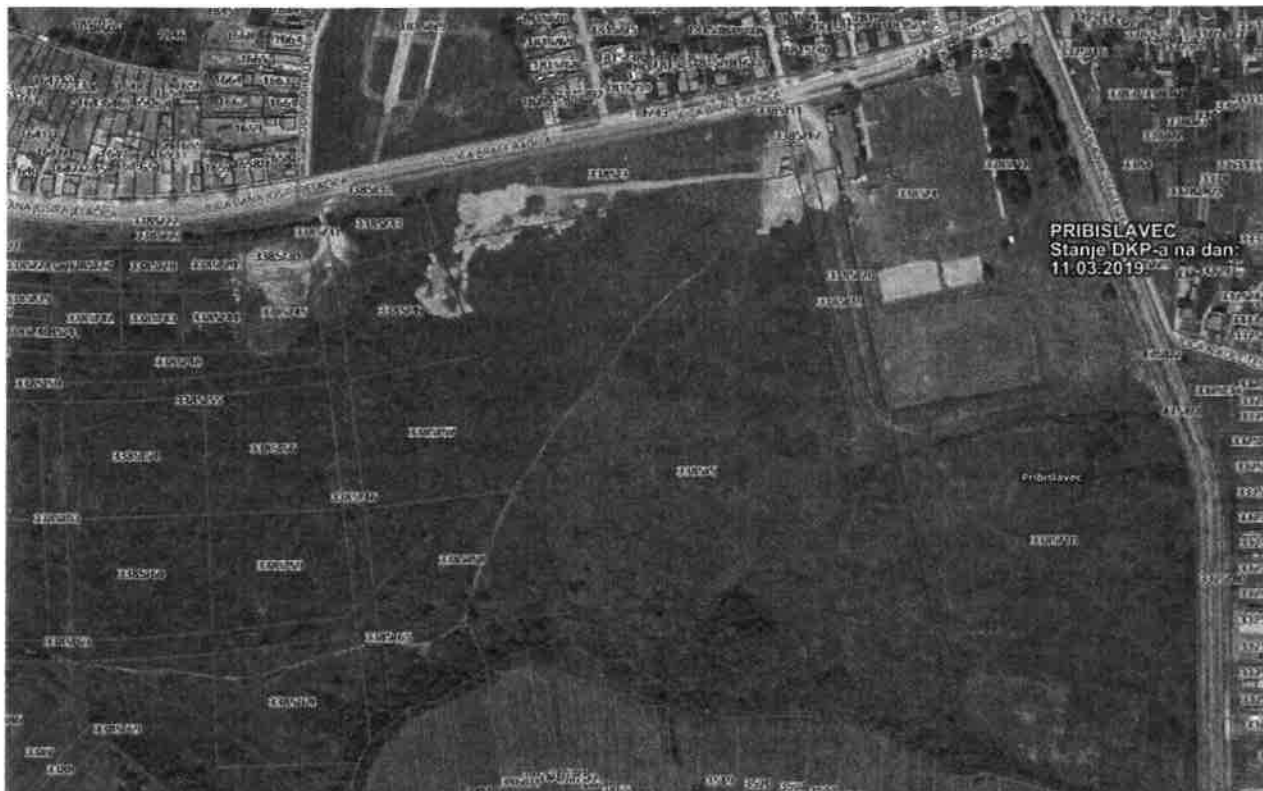
Grafički prikaz zemljišta k.č.br. 3385/5 i k.č.br. 3385/20

Za privođenje namjeni predmetnog zemljišta, Općina Pribislavec je dana 14.12.2013. godine donijela Odluku o donošenju Detaljnog plana uređenja „Područja 1“ u Pribislavcu, objavljenog u „Službenom glasniku Međimurske županije“ broj 19/13.