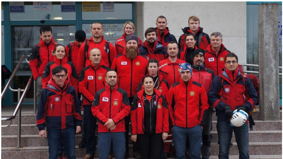
ČALNOVI HGSS STANICA ČAKOVEC 2018

Nitko od članova Stanice nije primio nikakve naknade niti dnevnice tijekom cijele 2018. godine za svoj rad i aktivnosti kroz rad u HGSS.