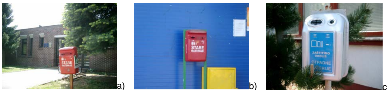
Slika 1.: Spremnici za baterije na području Županije